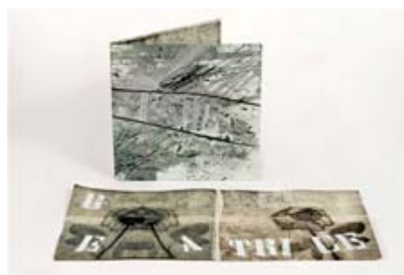
Elisabetta Diamanti Fede cm 25 x 25 x 1 Calcografia (2013)