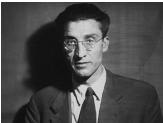
Lo scrittore Cesare Pavese, 1948, stampa gelatina sali d'argento, 18 x 24 cm

Dopo il secondo conflitto mondiale torna l'antica fama e tutto il gotha democristiano (De Gasperi, Gronchi, Andreotti ecc.) posa sotto le lampade di questa fotografa come attrici, scrittori e giornalisti di vaglia (Cesare Pavese, Valentina Cortese, Camilla Cederna). Si allontana dall'Italia sul finire degli anni Sessanta per trasferirsi in Israele, ad Haifa, dove muore nel 1972.