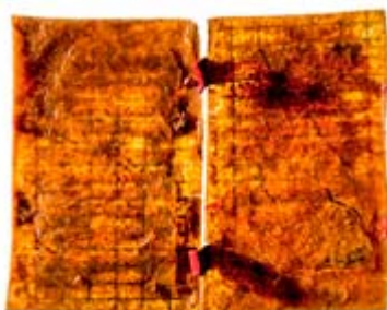
Francesca Cataldi Coro cm 45 x 29 x 2 Resina, rete, lana e vetroresina (1986)