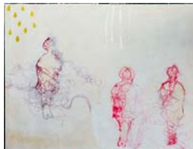
Primarosa Cesarini Sforza Moltitudine cm 42 x 29 x 3 Filo di seta e acrilico su carta (2012)